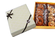
⑩ YNUサブレ&クッキー (サブレ6枚、クッキー5枚)

◆A群+B群+C群の中のいずれかより1点お選びください (20万円以上の方は2点お選びください)