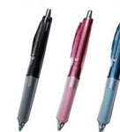
⑨ ドクターグリップ ボールペン&シャープペン