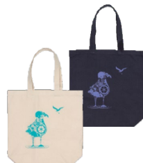
⑦ トートバッグ(M) 学生デザイン:カモメ