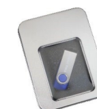
⑰ YNU USBメモリ 8GB

※複数回および毎年ご寄附いただく方で、それぞれ違うYNUグッズをご希望の方は、クレジットカードでお申込みの方は『寄附お申込み 入力画面』の『申込者情報入力』の"通信欄"に、申込書でお申込みの方は、『お申込書』に、希望等をご記載ください。