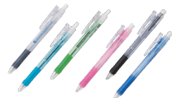
① ボールペン& シャープペンセット