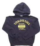
⑪ YNUスウェットパーカー ネイビー(S/M/L/XL)