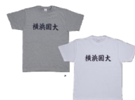
⑬ 横浜国大漢字Tシャツ グレー・白(S/M/L/XL)