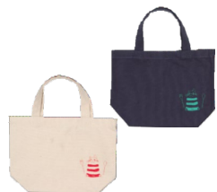
⑥ トートバッグ(S) 学生デザイン:猫